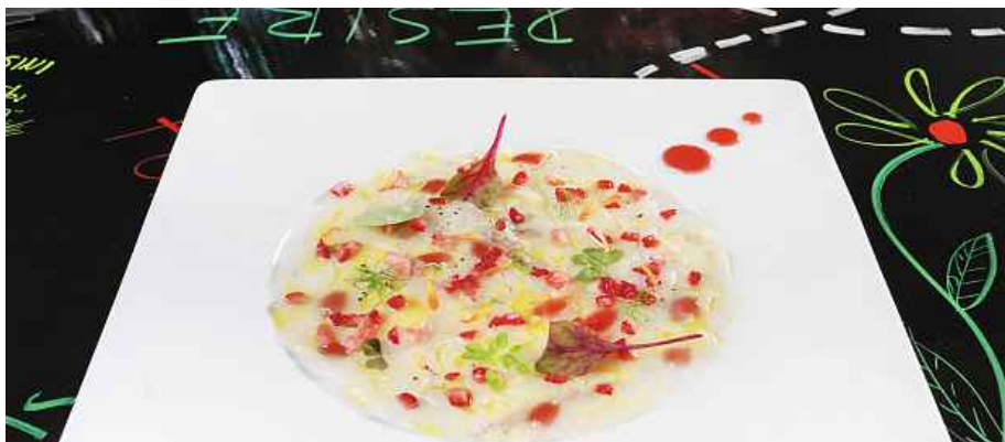
Restauraci Casa de Carli v květnu ocenila Accademia Italiana della Cucina za propagaci a ochranu italské kuchyně v zahraničí