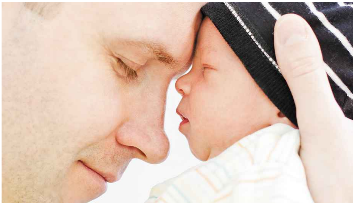
ILUSTRÁČNÍ FOTO SHUTTERSTOCK